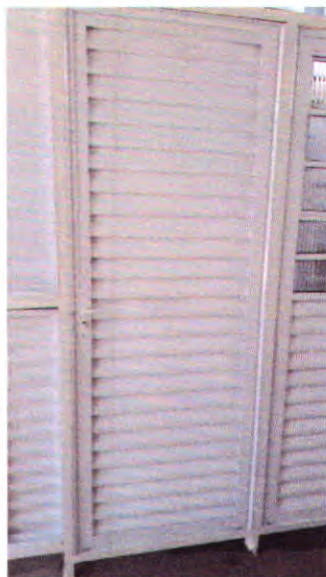
Serralheria – Portas dos Banheiros