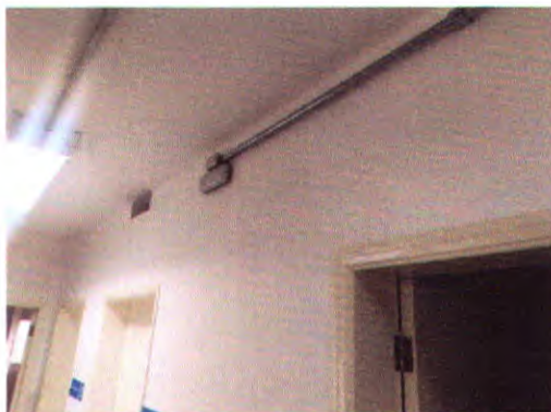
Revisão Elétrica e Instalação de Luzes de Emergência