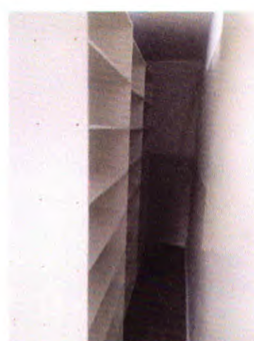
Marcenaria – Armários e Prateleiras