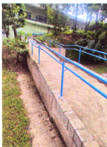
Serralheria – Instalação de Corrimão em Rampa de acesso