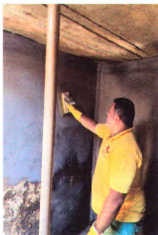
Limpeza e Impermeabilização da Caixa D'água.